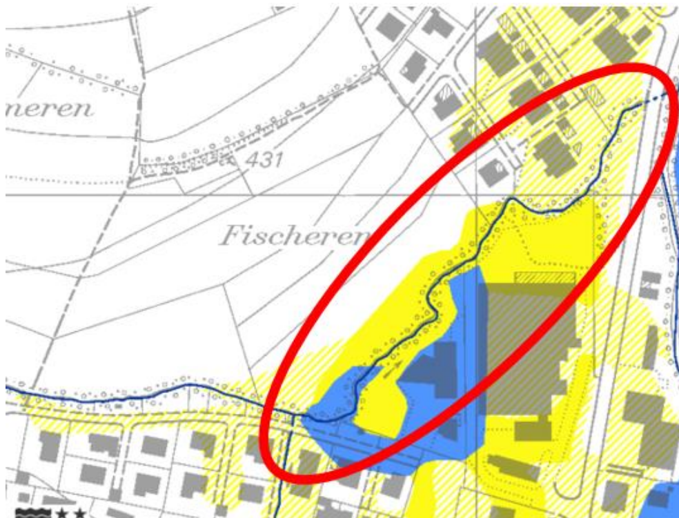
Gefahrenkarte Kt. AG

Das Projekt «Krummbach» erfuhr aufgrund der Hochwasserereignisse vom Sommer 2021 eine Überarbeitung resp. Anpassung. Der Durchlass «Oberlauf Krummbach» ist zusätzlich in das Projekt miteinbezogen worden. Den betroffenen Anwohnern und Landwirten wurde das Projekt am 29. März 2022 anlässlich eines Informationsabends vorgestellt. Zudem wurde an der Einwohnergemeindeversammlung vom 16. Juni 2022 umfassend darüber informiert. Der Baustart ist im Frühjahr 2023 geplant.