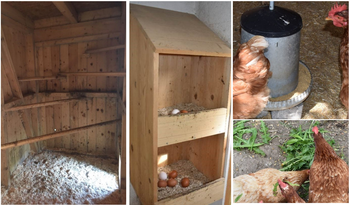
Abbildung 3: Im ersten Bild sind 5 Sitzstangen in unterschiedlichen Höhen zu sehen. Das mittlere Bild zeigt zwei auf drei Seiten und oben geschlossene Nester mit Einstreu. Rechts oben ist ein runder Futtertrog sichtbar. Löwenzahn und Körner werden als Ergänzung angeboten.