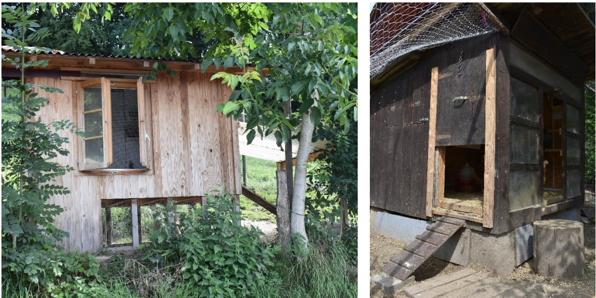
Abbildung 2: Zwei Beispiele von Ställen mit grossen Öffnungen, die Licht und Frischluft hereinlassen. Das linke Vordach des Stalls lässt sich an den Seiten mit Drahtgeflecht abschliessen, wodurch ein Wintergarten entsteht. Die Auslauffläche des Stalls auf der rechten Seite ist mit einem Netz abgegrenzt.

Die optimale Besatzdichte hängt u. a. von der Grösse und Stabilität der sozialen Gruppe ab. Bei kleinen Gruppen von 2 bis 15 Tieren wird eine Dichte von höchstens 4 Hühnern pro m 2 empfohlen.