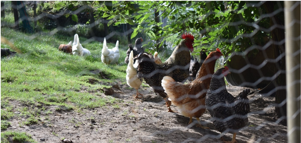
Abbildung 5: Auslauffläche mit natürlichem Schatten, Erde für Staubbäder sowie Gras für das Erkunden und Picken.

Der Stall muss mit Tageslicht beleuchtet sein und die Beleuchtungsstärke muss mindestens 5 Lux betragen, idealerweise aber mehr (siehe Art. 33 und 67 TSchV).