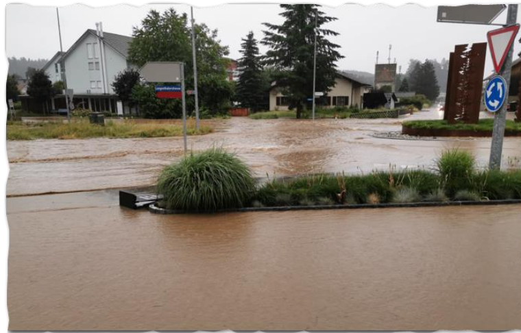
Hochwasser-Ereignis vom 24. Juni 2021

Das Hochwasser-Ereignis vom 24. Juni (siehe auch Informationen unter „Gemeinderat“) hat private Liegenschaftsbesitzer und die öffentliche Hand enorm gefordert. Die Hochwasserschutzmassnahmen „Pfaffnern“ sind mehr oder weniger abgeschlossen. Die Hochwasserschutzmassnahmen „Krummbach“ werden projiziert.