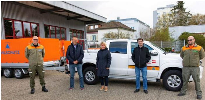
Bezug des neuen Zivilschutzmagazins auf dem Areal der Swissprinters AG

Im März wurde das zentrale Zivilschutzmagazin auf dem Areal der Swissprinters AG bezogen und damit die Einsatzbereitschaft weiter erhöht . Die erfolgreiche Feuertaufe des neuen Standortes erfolgte im Sommer bei den Unwettereinsätzen in der Region. Ab August konnten die Wiederholungskurse nach anderthalb Jahren pandemiebedingtem Unterbruch wieder durchgeführt werden.