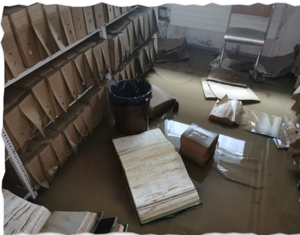
Hochwasser-Ereignis vom 24. Juni 2021